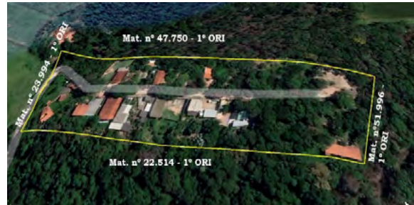
Imagem 1 – Imagem de Satélite do Loteamento “Recanto da Toca”